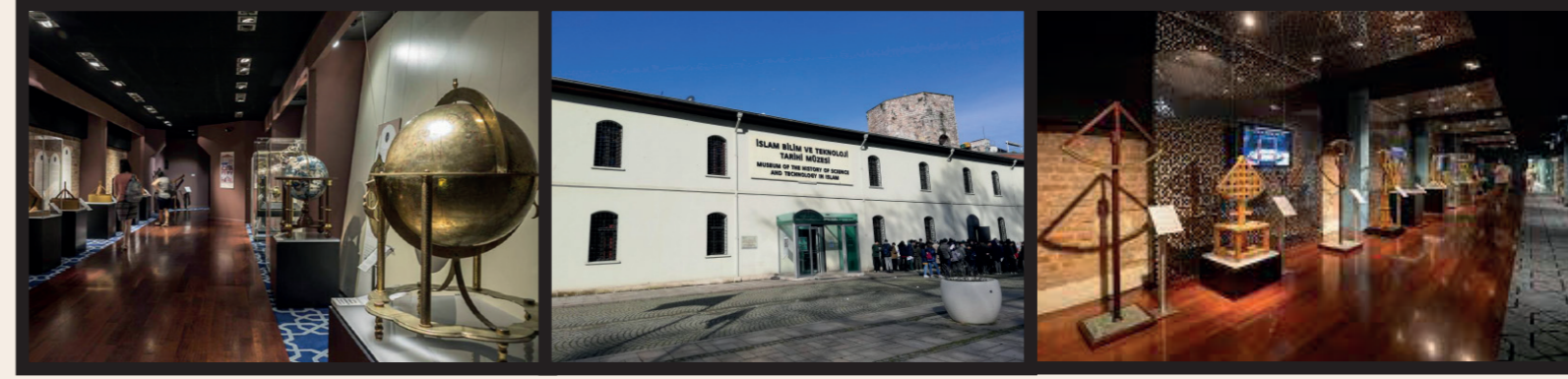
İSTANBUL İSLAM BİLİM VE TEKNOLOJİ TARİHİ MÜZESİ

Fuat Sezgin Hoca, aynı zamanda 2008 yılında İstanbul Gülhane Par-